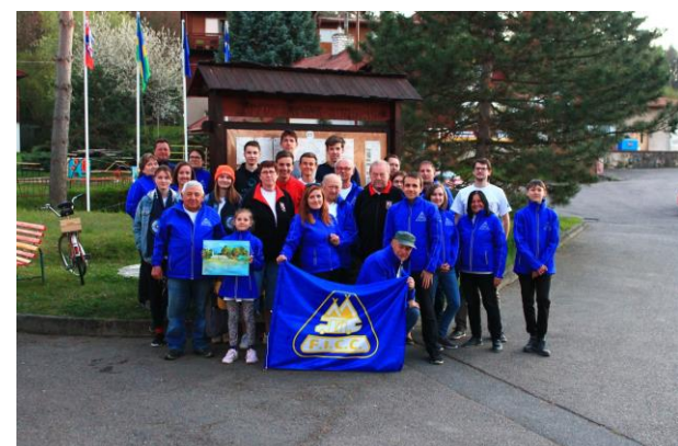
69 F.I.C.C. Youth Rally, Autocamping Konopac